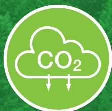
Empreinte de carbone